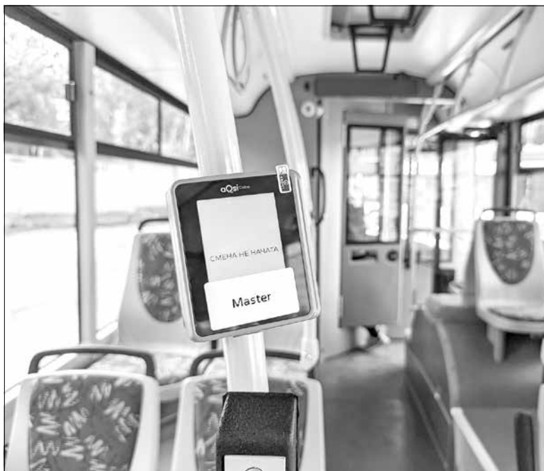
В салоне нового троллейбуса 30 сидячих мест, но всего может поместиться до 100 человек.

российский производитель и соберет троллейбусы, установит на них необходимое оборудование. Сегодня «Горожанин» используется в таких российских городах, как Новокузнецк, Ростов-на-Дону, Стерлитамак, Хабаровск, Чебоксары, Ковров, Пенза, Ижевск, Братск. Больше всего машин эксплуатирует Новосибирск.