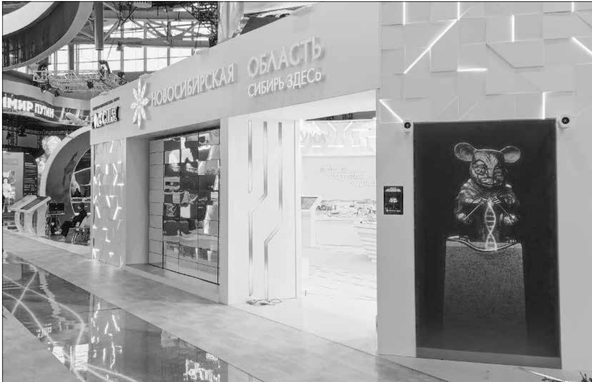
Стенд Новосибирской области «Новосибирь» на выставке-форуме «Россия» занял 21-е место из 128. Неплохой результат!

По словам Льва Решетникова, на стенде региона на про-