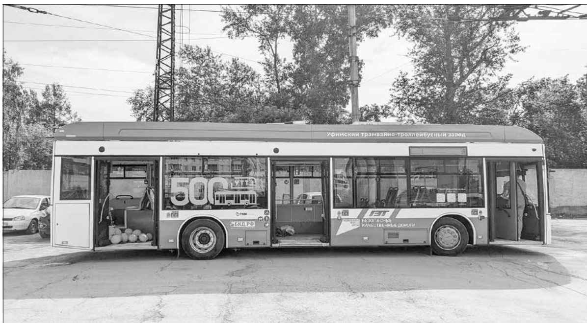
Юбилейный «Горожанин» демонстрировался на Российской неделе общественного транспорта и городской мобильности в Москве, теперь приступает к перевозке пассажиров в Новосибирске.

Модель «Горожанин» выпускается в Уфе с 2020 года, содействие оказывает Минский автомобильный завод. В течение 2024 года из Белоруссии будет доставлено 256 машинокомплектов, из которых