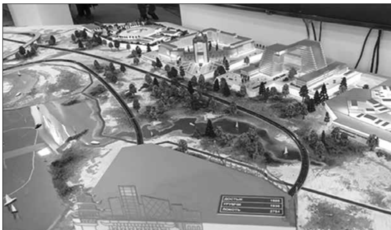
Макет Новосибирска и окрестностей вызвал огромный интерес у посетителей – за время работы экспозиции крохотный поезд прошел 1100 км.