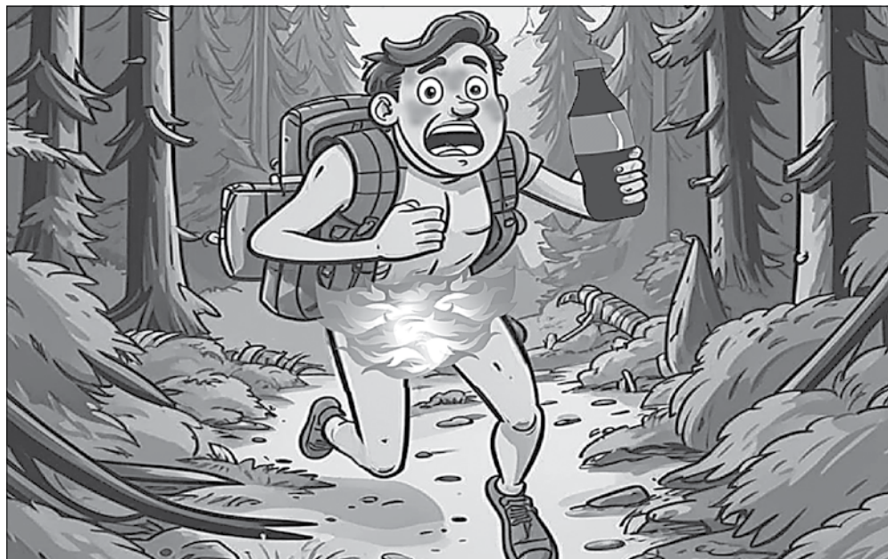
РИСУНОК: АЛЕКСЕЙ РЫГИН